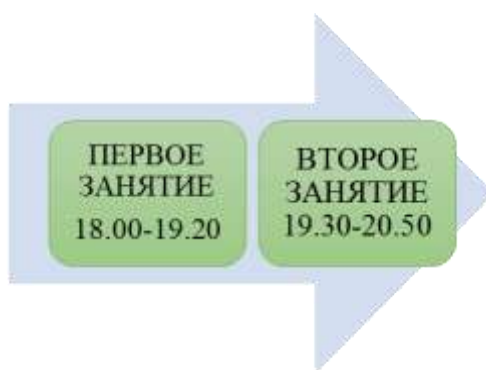
Рисунок 2 – Структура учебного процесса дня занятия

После успешного освоения учебного курса проводится государственный экзамен по специальности очно.