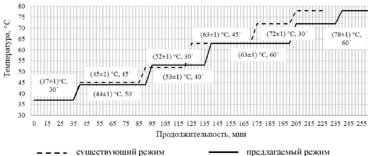
Рис. 3. Технологический режим затирания полисолодового сусла с использованием овса голозерного

В результате обработки уравнений определен оптимальный технологический режим затирания для полисолодового сусла, представленного на рис. 3, отличающийся от существующего белковой паузой, стадией осахаривания и продолжительностью выдержки.