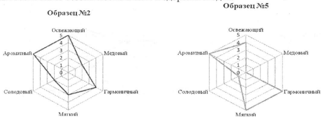
Рисунок 2 – Диаграммы вкуса выбранных образцов готового пива

современные требования к оформлению, обязательные требования к качеству пива, направленные на обеспечение безопасности жизни и здоровья людей.